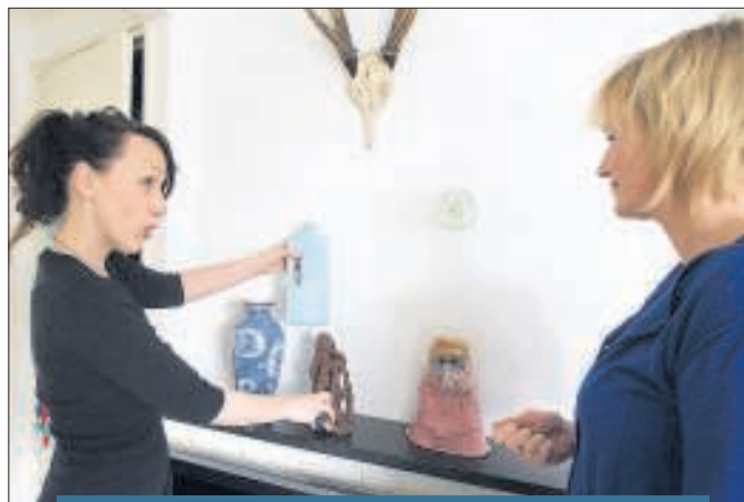
Beeldjes en vazen moeten bij elkaar passen.