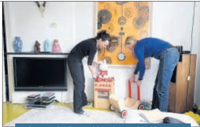
Opbergen dat bontgekleurde speelgoed.