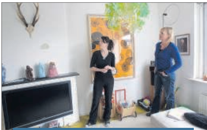
Onze kunst maakt de muren onrustig.