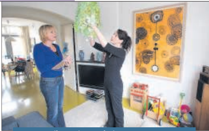
Weg met die Tord Boontje-lamp.